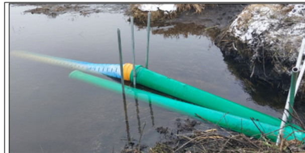
Abb. 8: Mit Metallstangen fixierte Drainagerohre