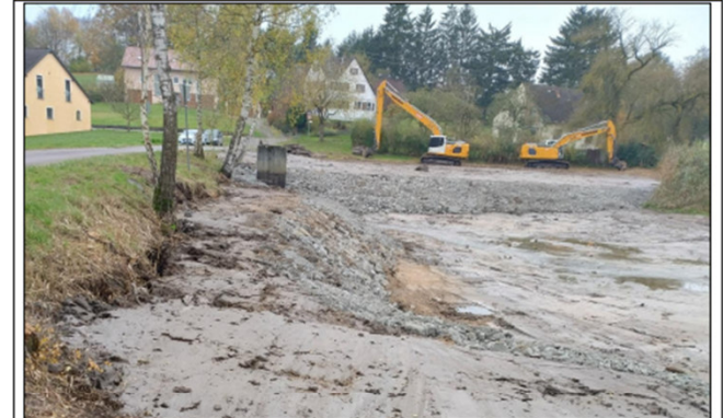
Abb. 1: Einbau von einer Steinschüttung an einem Stillgewässer.