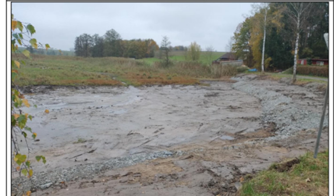
Abb. 2: Einbau von einer Steinschüttung an einem Stillgewässer.