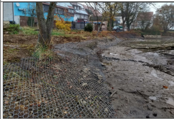
Abb. 3: Auf ein Gewässerufer aufgelegtes Biberschutzgitter in der Bauphase.