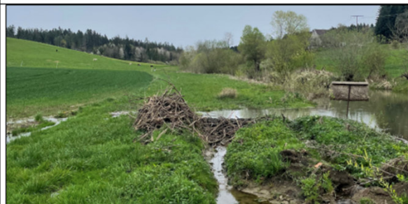
Abb. 2: Angelegte Bypässe an einem Biberdamm. Der zunächst angelegte Bypass (Bildmitte) wurde vom Biber nach kurzer Zeit wieder verschlossen, sodass ein weiteres Umgehungsgerinne (ganz links im Bild) angelegt wurde. Dieses wurde vom Biber akzeptiert und sorgt dafür, dass die angrenzende Ackerfläche weitestgehend trocken bleibt.