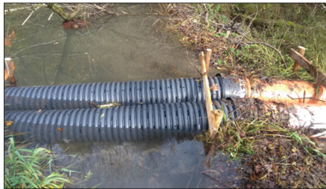
Abb. 11: Im Damm eingebaute Drainagerohre. Auch die doppelte Verlegung ist möglich (bspw. bei Gewässern mit möglichen hohen Durchflussmengen).