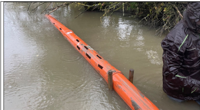
Abb. 10: Ein durch den örtlichen Bauhof selbst geschlitztes KG-Rohr.