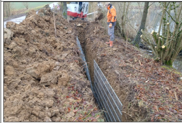
Abb. 2: Um ein Eingraben in den Dammbereich und Schäden an dem angrenzenden Weg zu vermeiden, wird ein „Biberschutzgitter“ eingegraben.