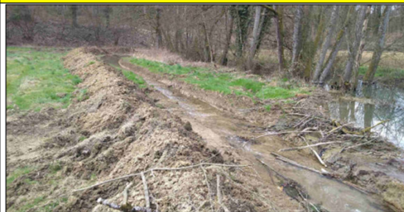
Abb. 1: Angelegtes Umgehungsgerinne. In der rechten Bildmitte ist der Biberdamm zu erkennen. Die Ausleitung des Wassers erfolgt hier weit oben im Rückstaubereich, was die Wahrscheinlichkeit erhöht, dass der Biber den Bypass nicht wieder aktiv zubaut.