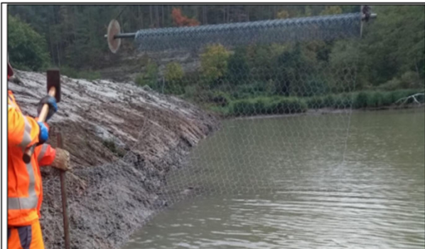
Abb. 2: Einbau Biberschutzgitter mittels Bagger. Wichtig ist, dass das Gitter möglichst bis zum Gewässergrund auf das zu schützende Element (hier ein Damm) gelegt wird. Hierzu kann es notwendig sein, vorab den Wasserspiegel abzusenken.

Maßnahmensteckbrief Auflegen von Drahtgittern