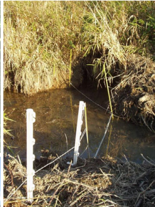
Bilder Gerhard Schwab, Elektrozaune