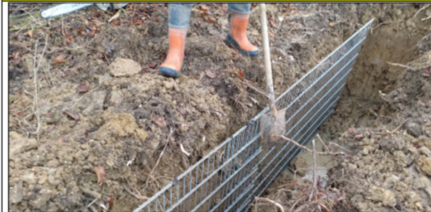
Abb. 1: Eingraben eines „Biberschutzgitters“ in der Bauphase.